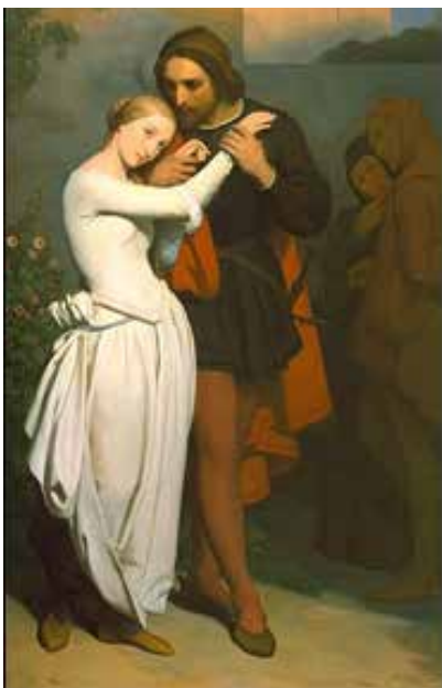
Ary Scheffer (1795-1848), Marguerite et Faust dans le jardin , 1846, Melbourne, National Gallery of Victoria