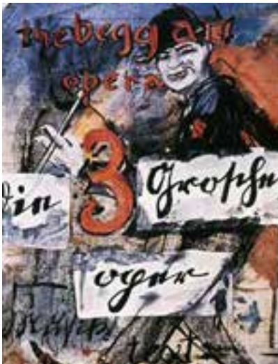
affiche de la première représentation de l'Opéra de Quat'sous, à Berlin, le 31 août 1928. Opéra en un prologue et huit tableaux. Livret de Berthold Brecht, adapté de l'opéra de Christopher Pepush et John Legay, The Beggar's Opera (l'Opéra des gueux). Musique de Kurt Weill (1900-1950)

Les deux artistes, Brecht et Weil ont l'ambition d'un théâtre politique qui mène le public à la réflexion et à l'action.