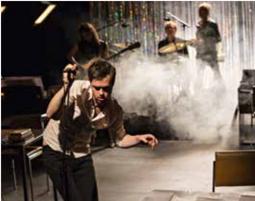
DJ set (sur) écoute, Mathieu Bauer