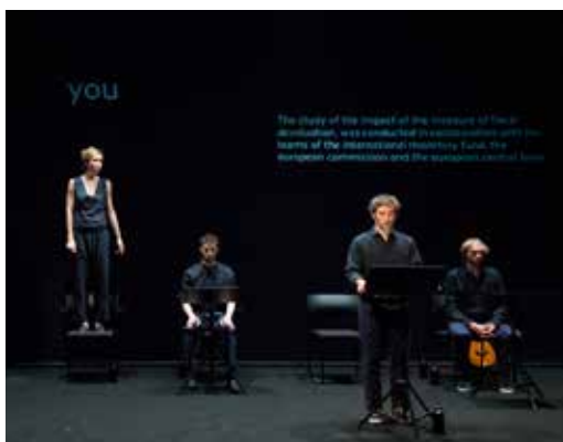
Suite n°2 , Encyclopédie de la parole / Joris Lacoste ©Bea Borgers