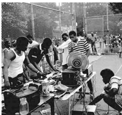
DJ Kool Herc (Sound System 1975)