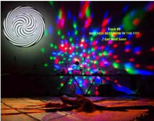
MDLSX, Compagnie Motus