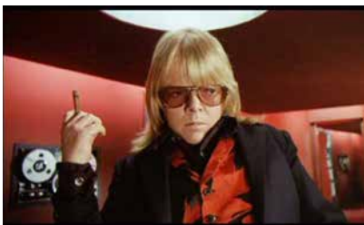
Le film de Brian de Palma, Phantom of the Paradise , met en scène un personnage diabolique, le producteur Swann, lui-même image très noire de Faust.