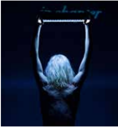
MDLSX, Compagnie Motus