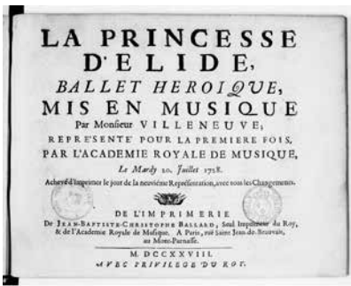
La Princesse d'Elide, ballet héroïque... représenté pour la 1 ère fois par l'Académie royale de musique le 20 juillet 1728

Au fil des siècles, le théâtre occidental a pris l'habitude de dissocier les pratiques et de multiples catégories se sont imposées : au XVII e siècle, l'opéra italien initié par Monteverdi, la tragédie lyrique imposée par Jean-Baptiste Lully en France aboutissent à une distinction forte : théâtre, musique et chant, à chaque art sa spécificité et ses usages.