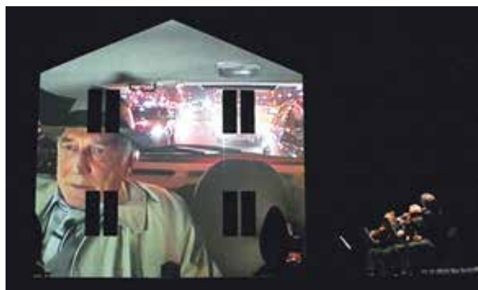
Eraritjaritjaka en 2004 de Heiner Goebbels (scénographe et musicien)

Aujourd'hui, les manifestations du « théâtre musical » sont multiples et recouvrent des réalisations très diverses : « De nombreux objets théâtraux non ou mal identifiés naissent du dialogue incessant de ces deux langages artistiques qu'il n'est pas toujours aisé de nommer : opéra de poche, opéra rock, cabaret, lecture-concert, comédie musicale, théâtre instrumental, tanztheater, etc. C'est dire la richesse d'un genre hétéroclite et foisonnant qui invente bien souvent de nouvelles formes. Dans ce chassé-croisé continu où les gros plans et les fondus s'enchaînent entre théâtre et musique, les spectacles deviennent un des hauts lieux d'invention et de renouvellement de l'art du montage sous toutes ses formes ». 2