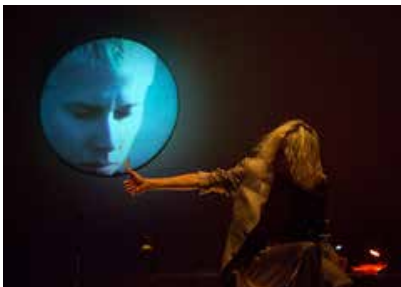
MDLSX, Compagnie Motus

Dans la deuxième moitié du XX e siècle, le concept de genre est apparu au croisement de la réflexion dans les domaines de la médecine, de la philosophie et de la sociologie. Il a permis de dissocier sexe biologique (homme, femme) identité sexuelle (masculin/féminin), orientation sexuelle. Il a également mis en avant l'importance de l'environnement et de l'éducation dans la construction de l'identité sexuelle de chacun. Par cette dissociation intellectuelle entre le biologique et le culturel, la notion de genre a ainsi remis en cause un certain nombre de clichés liés au sexe, comme par exemple l'idée que certains goûts (couleur bleue ou rose, dînettes contre voitures, ménage contre bricolage) seraient de toute éternité masculins ou féminins. De manière plus large, cette interrogation sur le genre a conduit à approfondir l'analyse des rapports de domination des hommes sur les femmes.