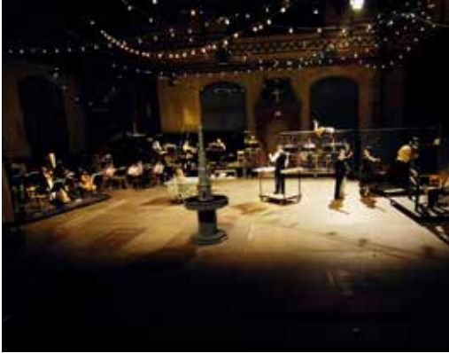
Votre Faust, mise en scène Aliénor Dauchez

ALIÉNOR DAUCHEZ / COMPAGNIE LA CAGE / TM +