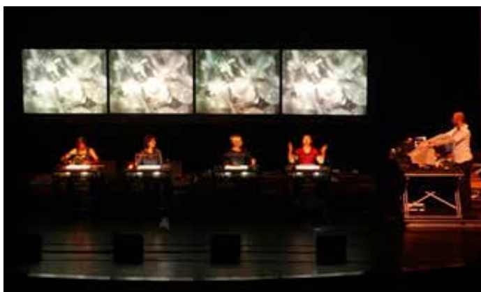
Machinations , 2000 Une œuvre de Georges Aperghis avec la collaboration de François Regnault : quatre voix de femmes, manipulées par ordinateur. Georges Aperghis, compositeur, fonde en 1974 l'ATEM (Atelier théâtre et musique) et recherche la symbiose.

La représentation devient constitutive de l'œuvre et les formes (texte, chant, musique) se mêlent à nouveau sans que l'une prenne le pas sur l'autre.